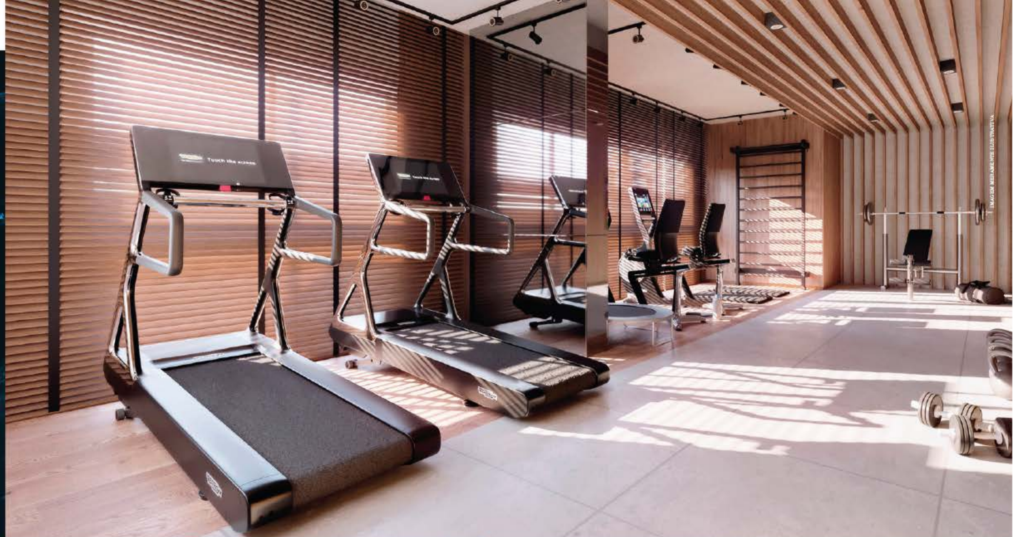
IMAGEM: MESA MONTES ELITE/STUDIO V.A.