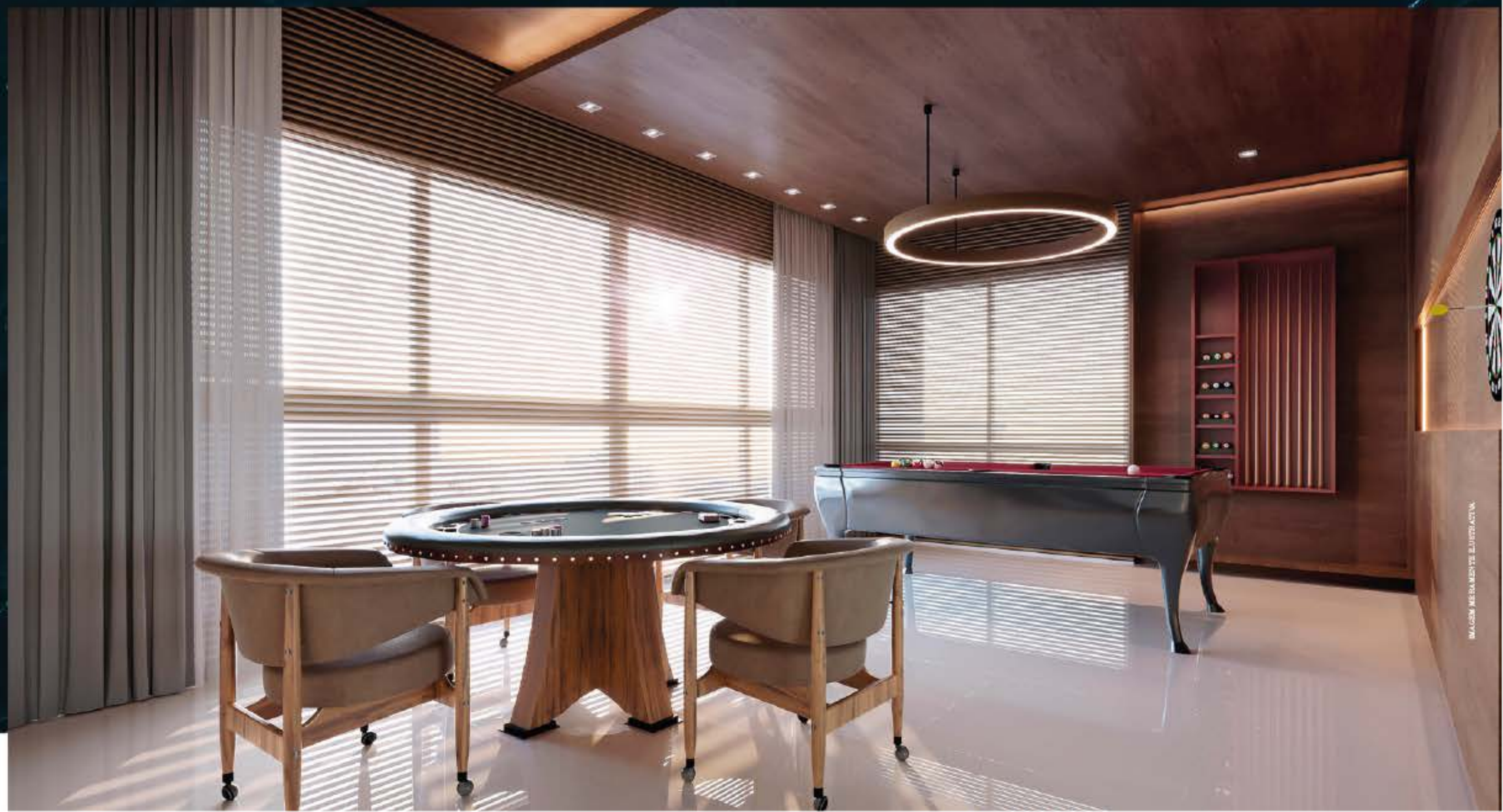
IMAGEM: MESA MONTES ELITE/STUDIO V.A.

Mobiliada, decorada, climatizada e equipada.